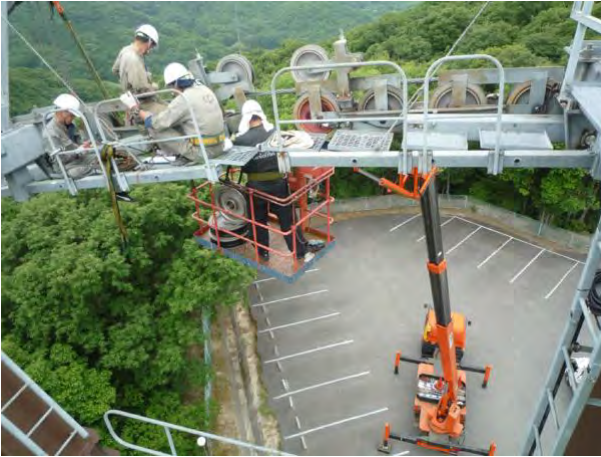
<支柱 索輪交換作業>