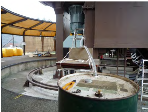
<減速機オイル交換>