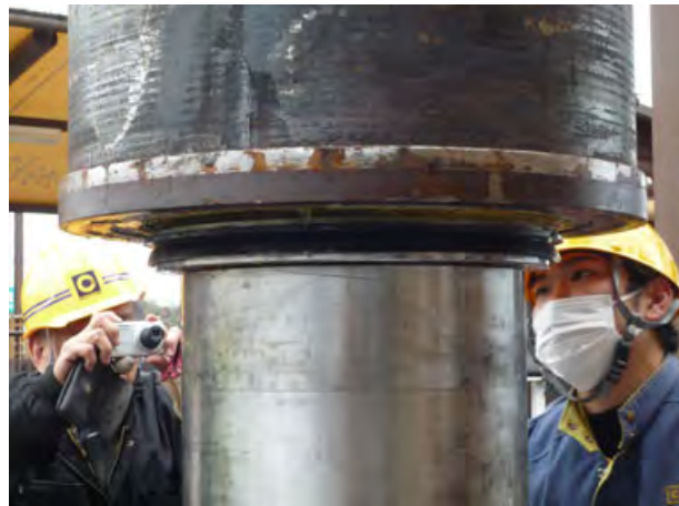
<制動試験用ウェイト積み込み状態>