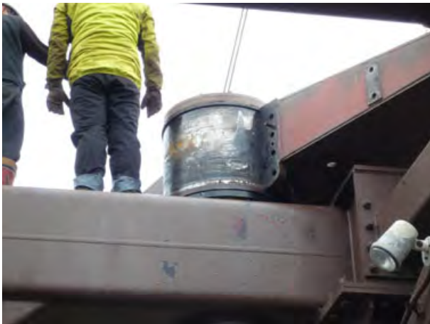
<搬器 握索部移動作業>