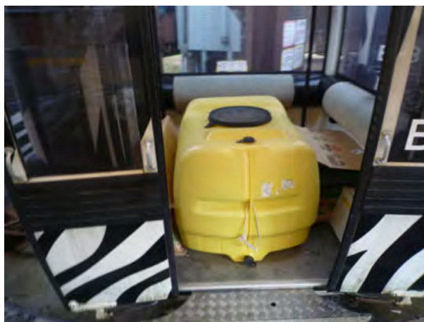
<減速機オイル交換作業>