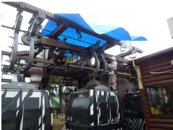
<高位置での救助訓練>