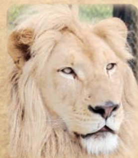
ホワイトライオン

ウォーキングサファリは、緑に囲まれたコース内を自由に歩きながら、さまざまな動物たちと間近に遭遇するサファリです。