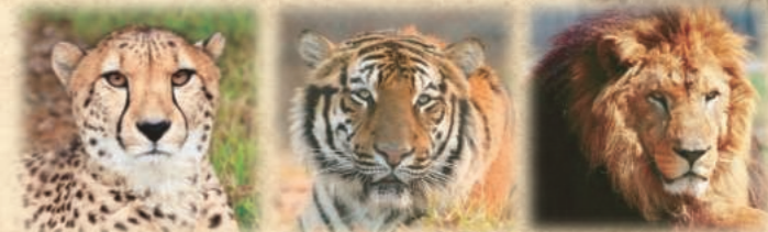
チーター トラ ライオン

迫力ある猛獣の肉食動物を、車窓から間近に見ることができます。間近でその迫力ある姿をじっくりとご覧ください。