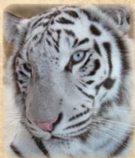
ホワイトタイガー